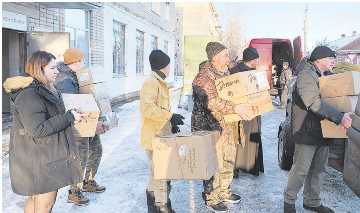
Более 8 тонн гуманитарного груза доставлено в зону СВО для наших земляков

Всю организацию по сбору и отправке очередной партии гуманитарного груза участникам спецоперации взяли на себя общественная организация «Боевое братство» и администрация Боровичского муниципального района. Это уже не первая поездка на Донбасс: боровичане организовали регулярную гуманитарную миссию на линию боевого соприкосновения.