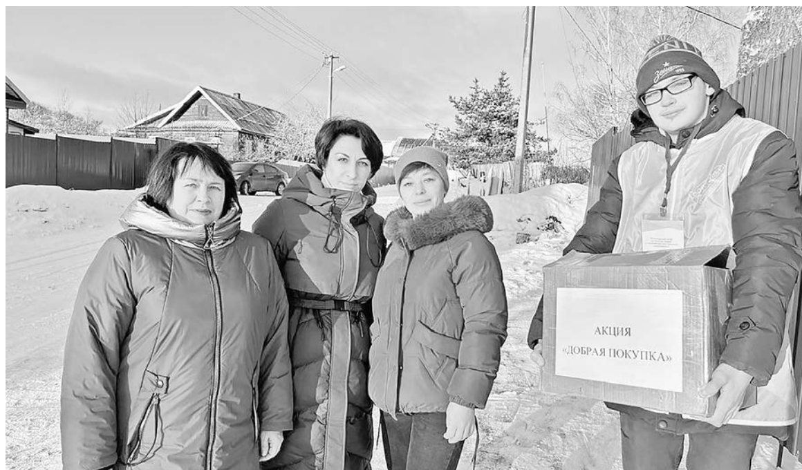
Боровичане приняли участие в акции «Добрая покупка», организованной для семей мобилизованных земляков