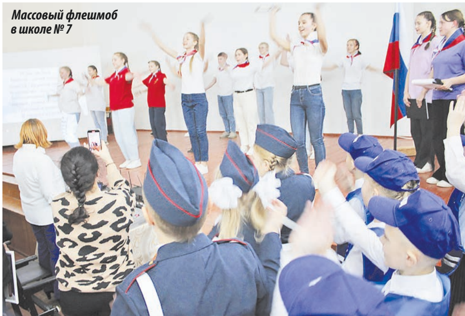
Массовый флешмоб в школе № 7